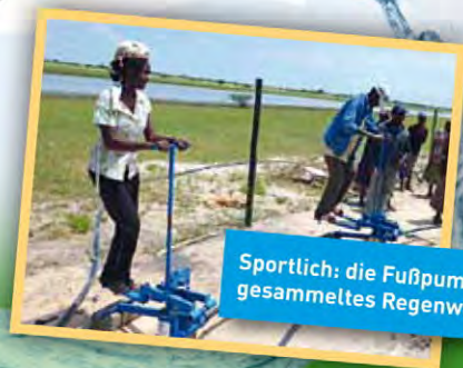
Sportlich: die Fußpumpe für gesammeltes Regenwasser