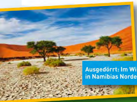
Ausgedörrt: Im Winter regnet es in Namibias Norden überhaupt nicht.

Kleine, abgelegene Dörfer haben außerdem keine Wasserleitungen. Die Leute müssen oft kilometerweit bis zum nächsten öffentlichen Wasserhahn laufen – und das Wasser anschließend den weiten Weg im Kanister auf dem Kopf nach Hause balancieren.